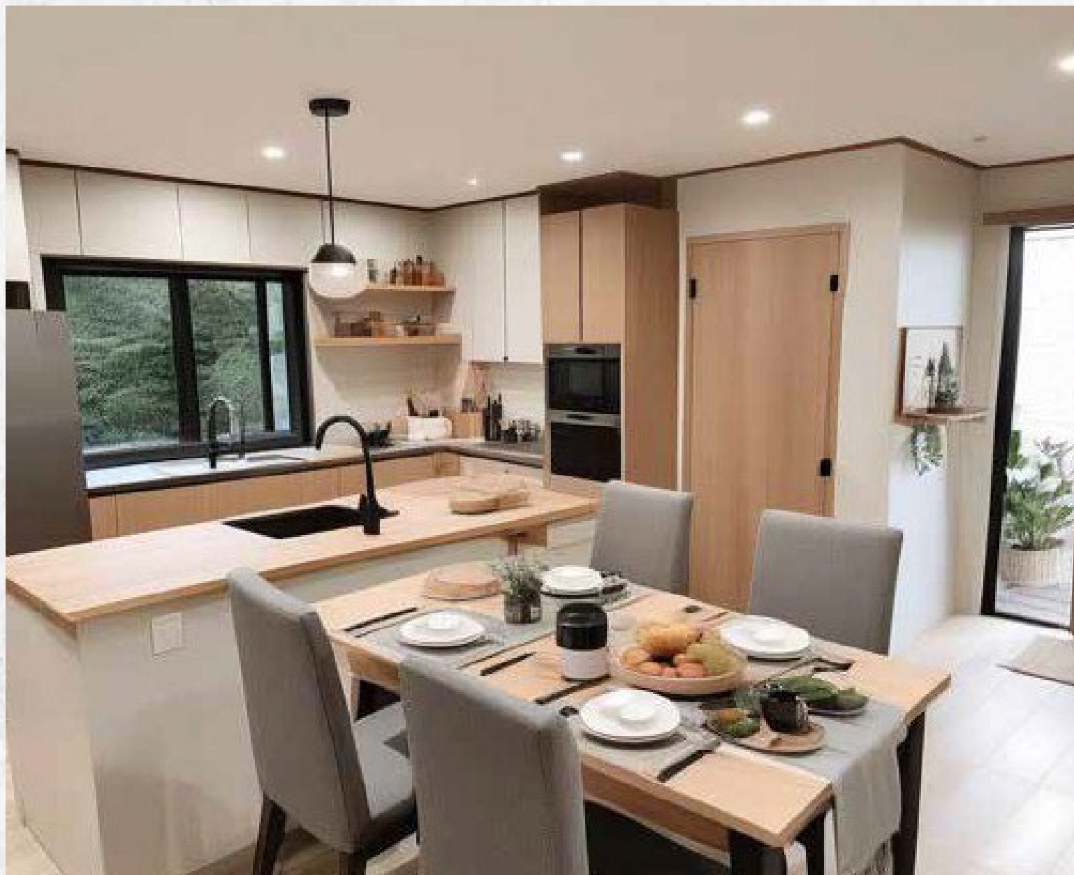
Espace cuisine - salle à manger