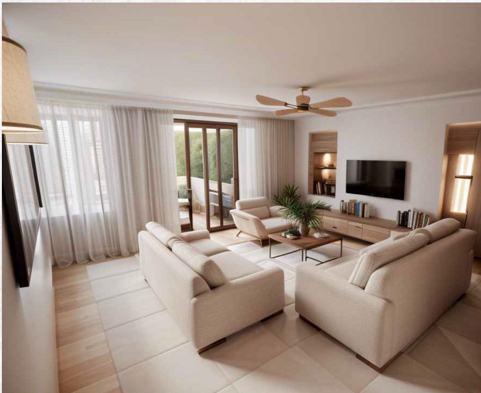
Séjour lumineux et luxueux