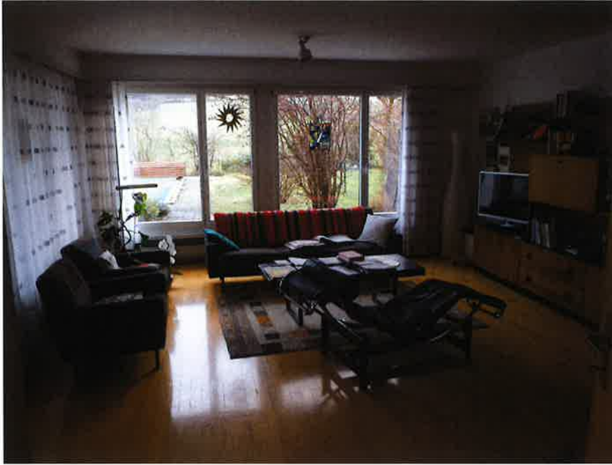
Wohnzimmer mit Blick nach Süden, Garten und Pool.