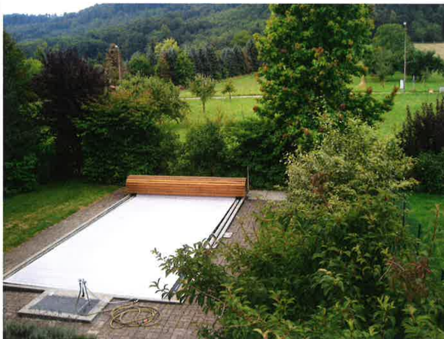
Blick nach Süden aus dem 1. Stock Zimmer rechts.