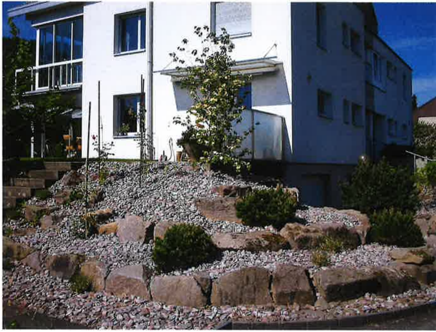
Blick nach Süd- West an die Ostfassade. Nach Gartengestaltung 2010.