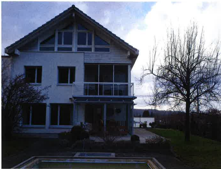
Südfassade mit Blick nach Norden