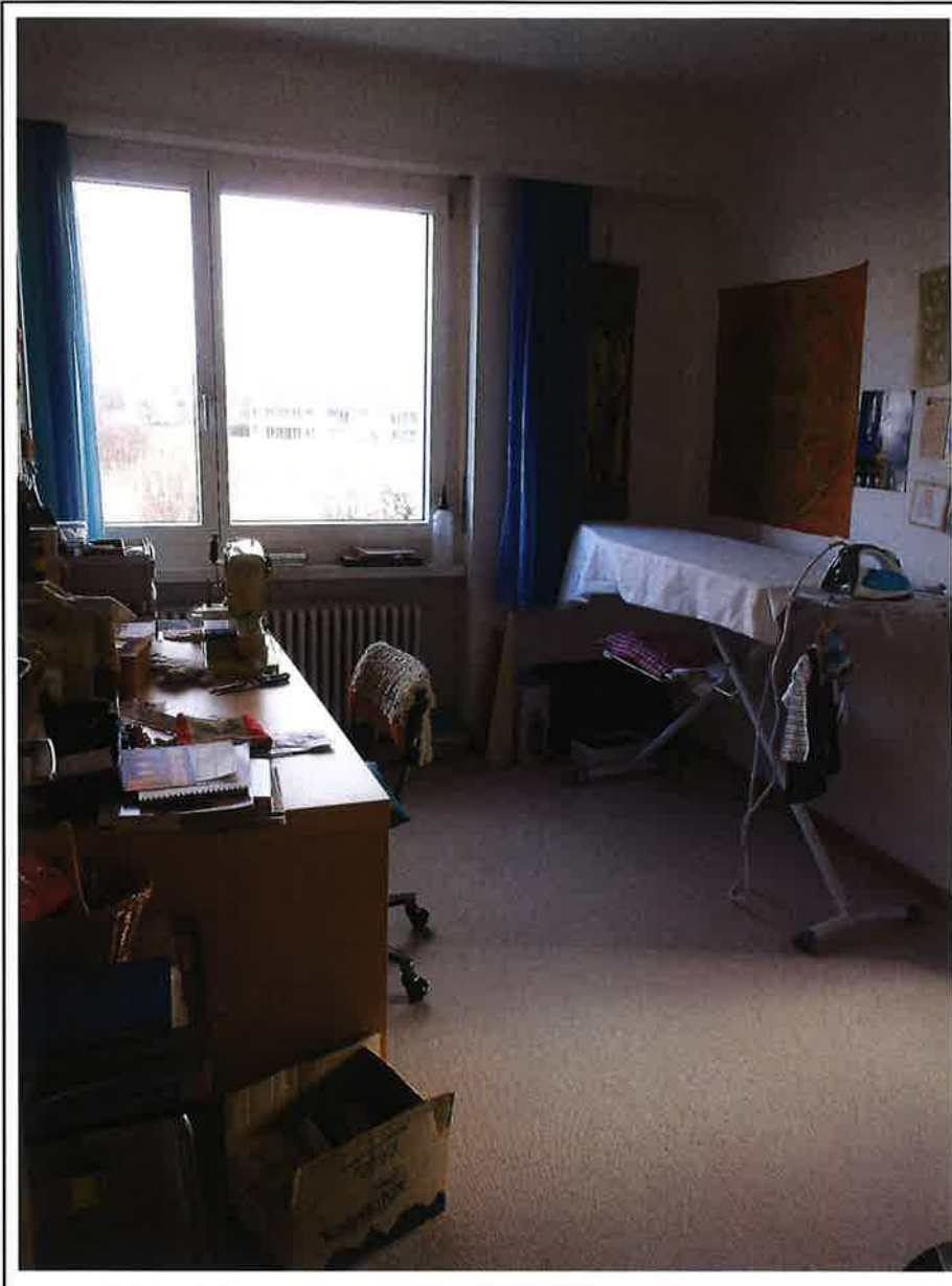
Zimmer mit Blick nach Osten & Süden sowie Zugang zur Terrasse im 1. OG.