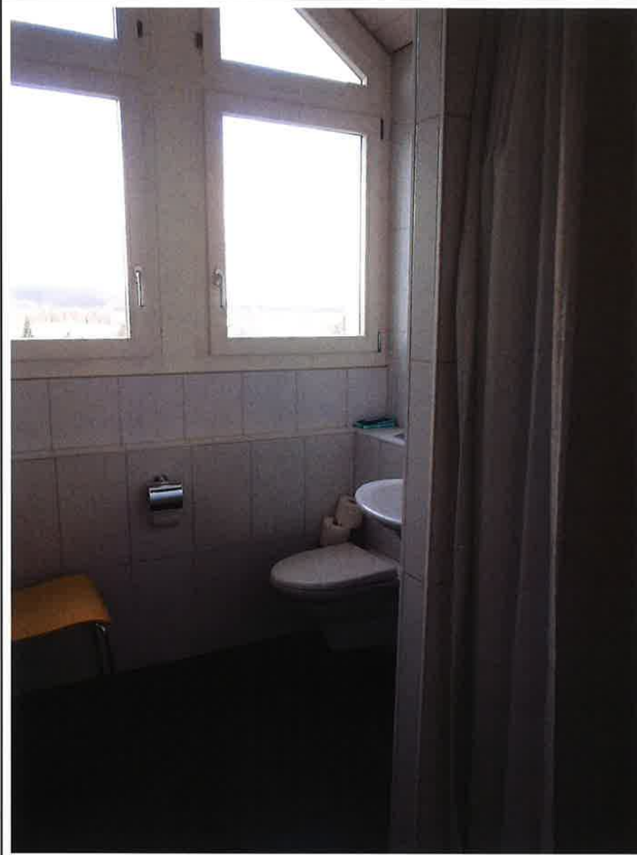
WC/Dusche im Dachgeschoss. Blick nach Norden.