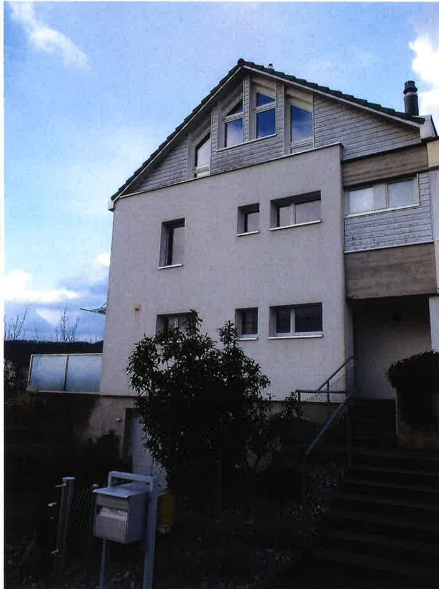
Blick nach Süden an die Nordfassade mit Haupteingang. Dachaufbau aus dem Jahr 2000.