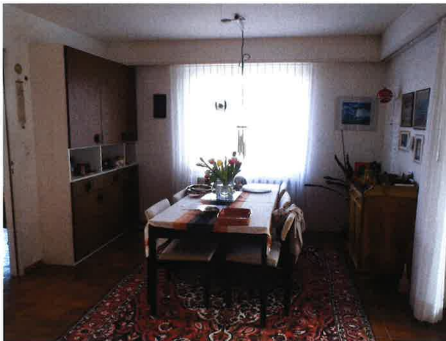
Essbereich. Aktuell wird die linke Wand (zur Küche) entfernt um eine neue Wohnküche (Juni 2024) zu installieren. Blick nach Osten.