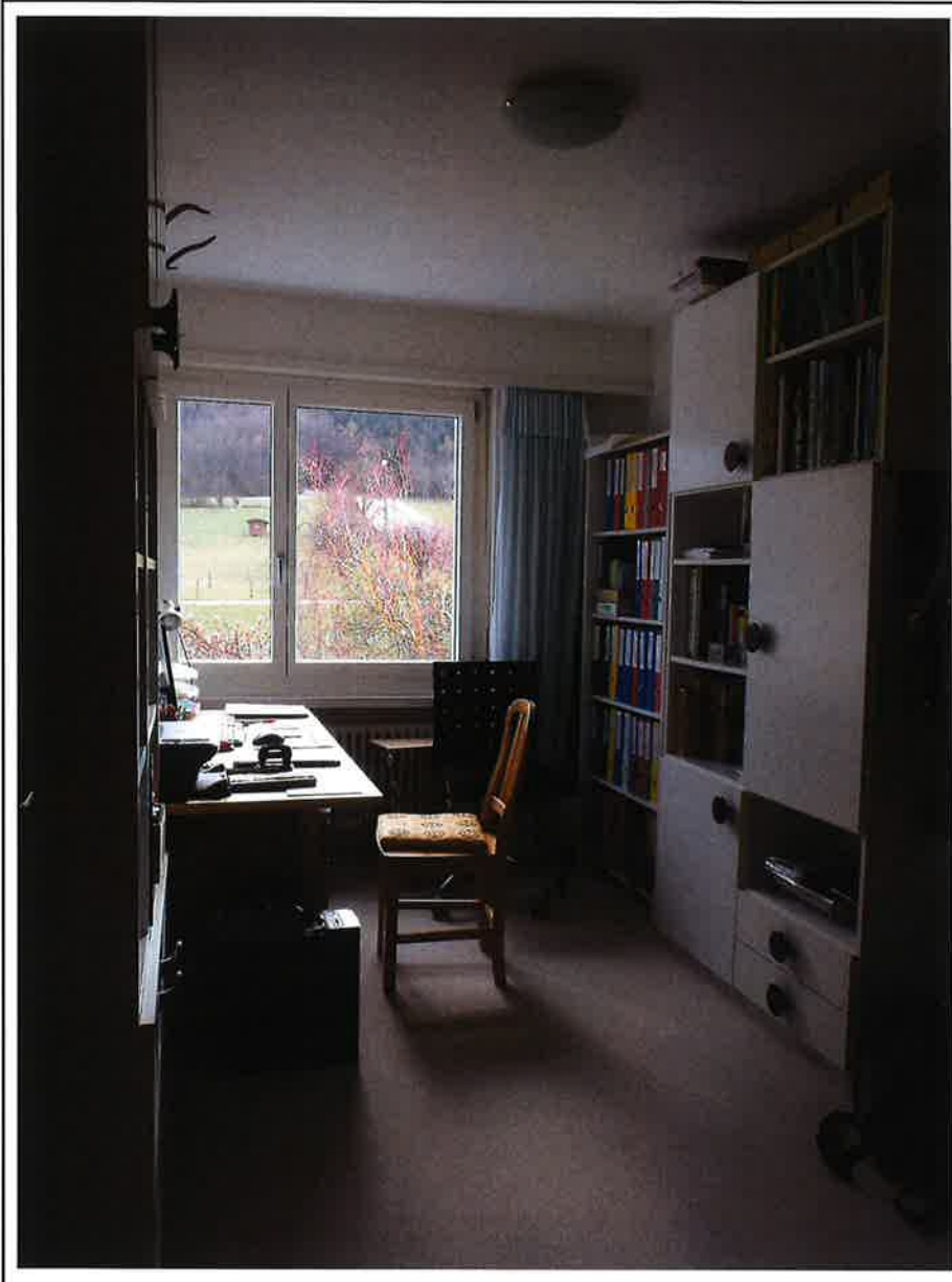
Zimmer mit Blick nach Süden.