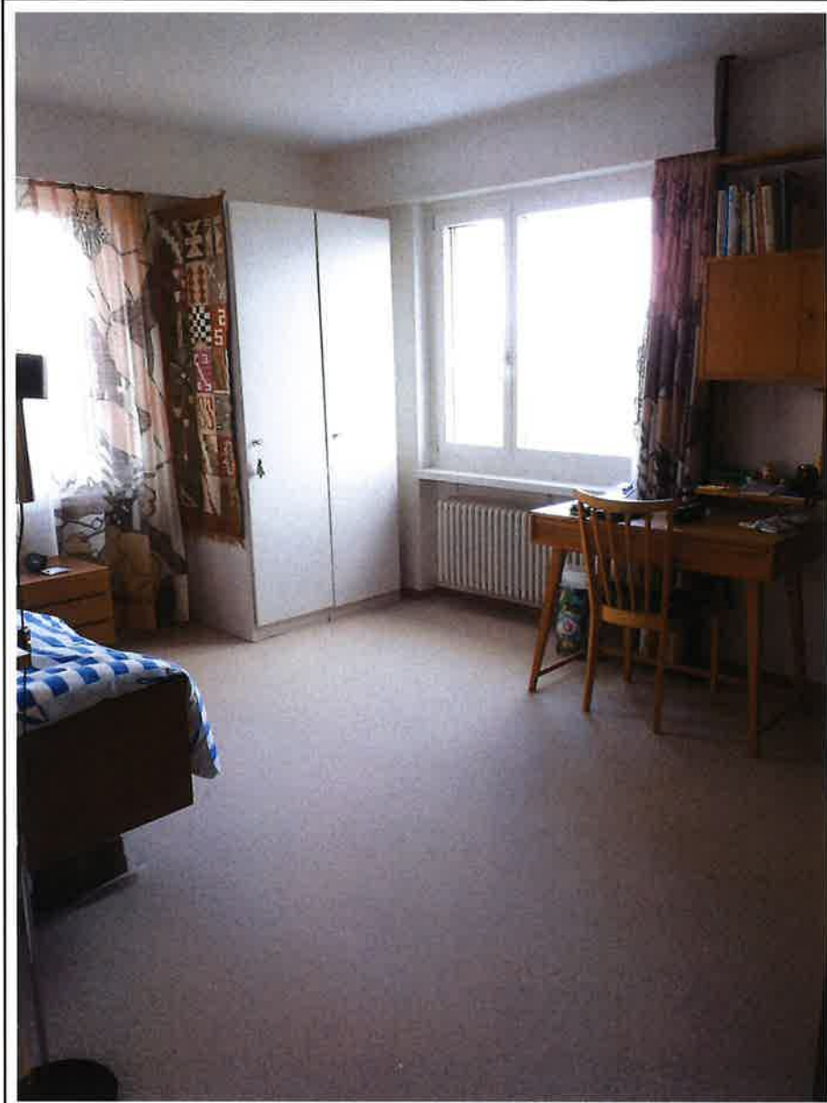
Grosses Zimmer m. Blick nach Nord/Ost.