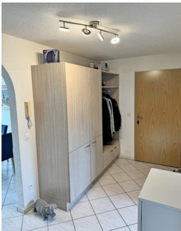
Entrée mit geräumiger Garderobe