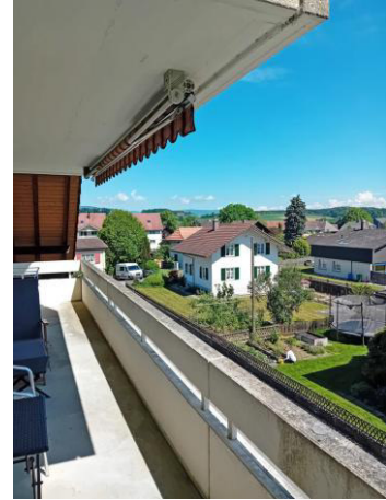
...bis zum Jura