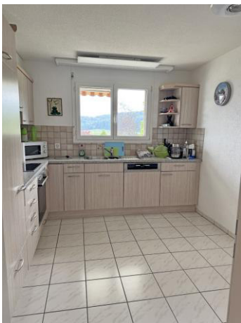
Essküche mit vielen neuwertigen Geräten