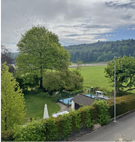
...herrlicher Weitsicht ins Grüne, ...