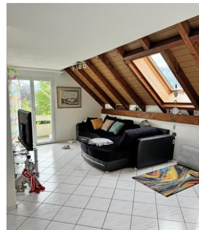
vom Wohnzimmer auf den Balkon mit...