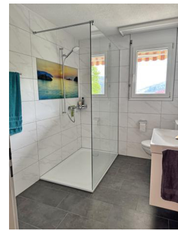
Bad mit begehbarer Dusche – 2025 renoviert