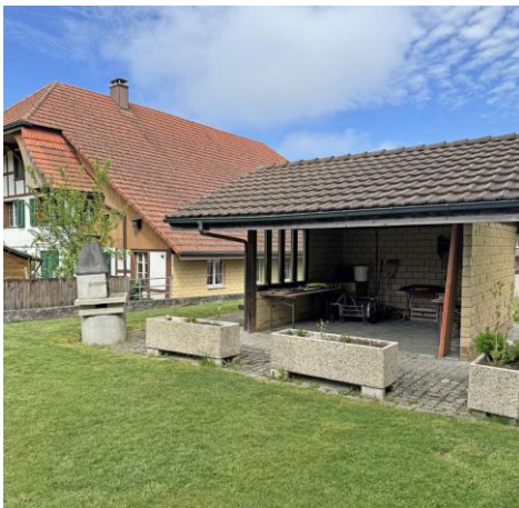
Gartenhaus mit Grill zur Mitbenutzung