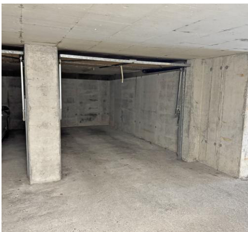
Garagenbox in der Tiefgarage