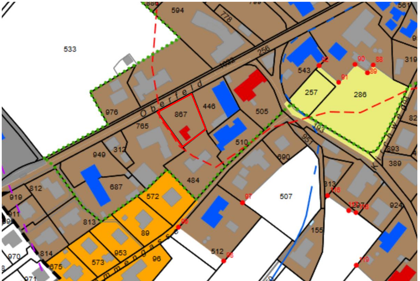
Art. 4 Mass der Nutzung

1 Für die einzelnen Bauzonen gelten die folgenden baupolizeilichen Masse: 1