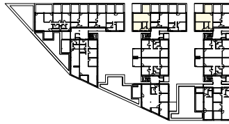
Übersicht 3. OG