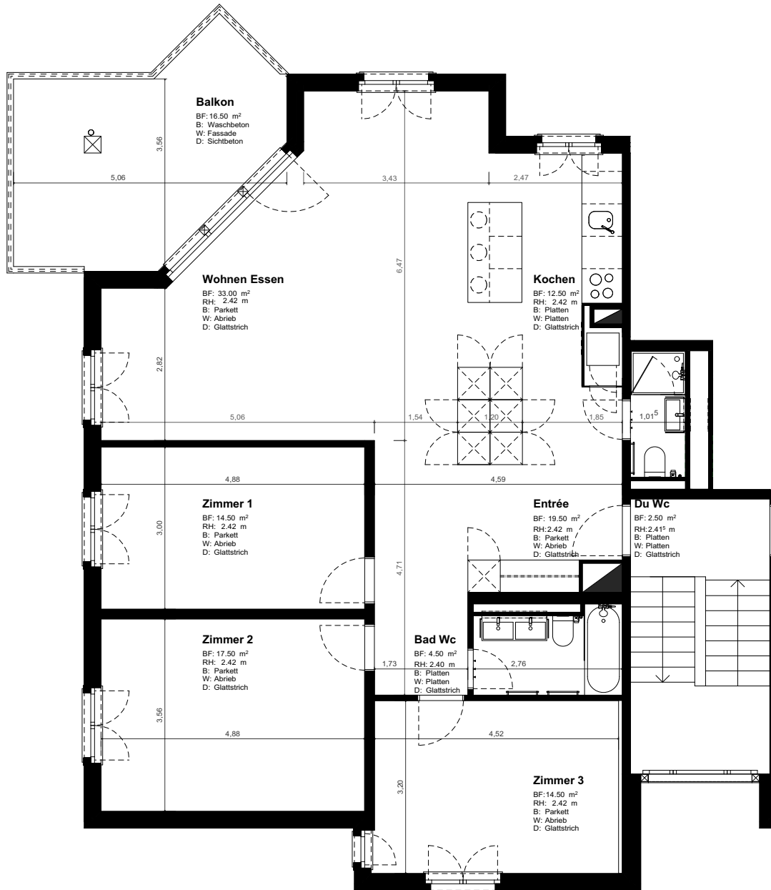
Grundriss 1.OG, Links