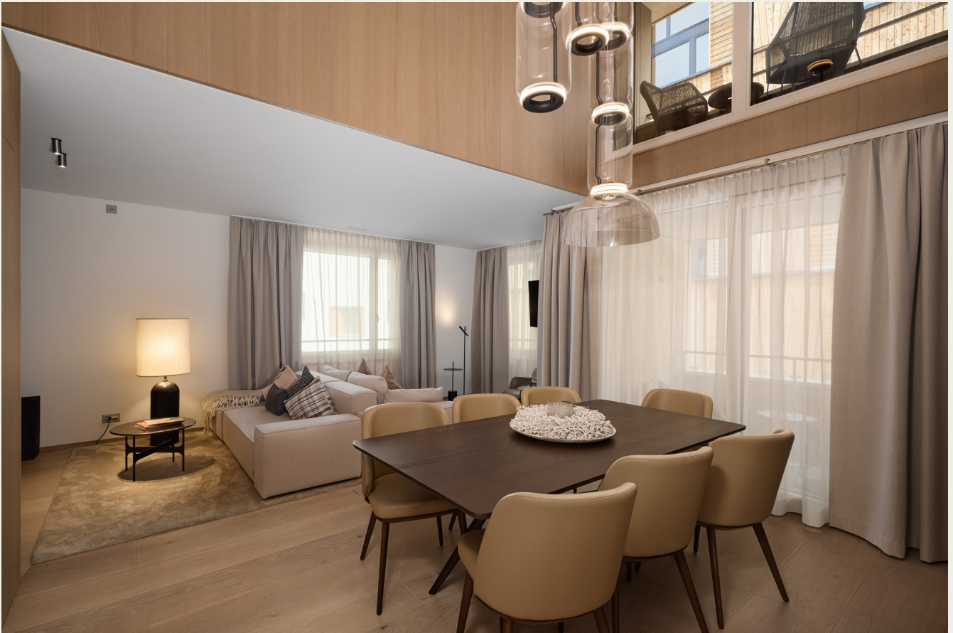
Wohnbereich und Esszimmer