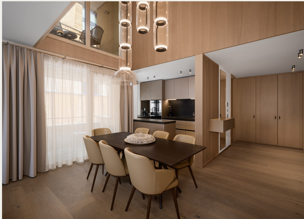
Küche und Esszimmer