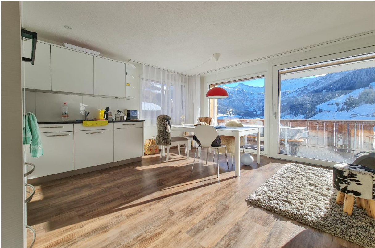
Die offene moderne Küche mit Geschirrspüler, Cerankochfeld, Dunstabzug