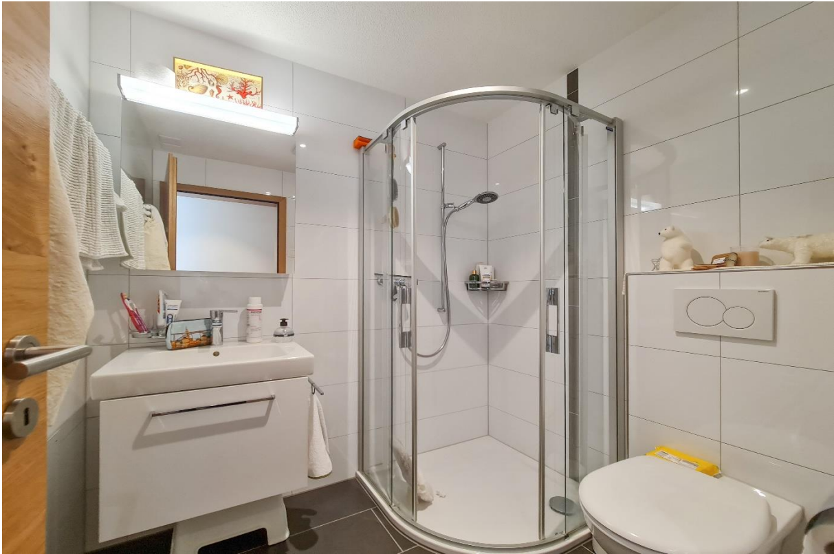
Das Badezimmer mit step in Dusche, Toilette, Handwaschbecken und Handtuchrockner