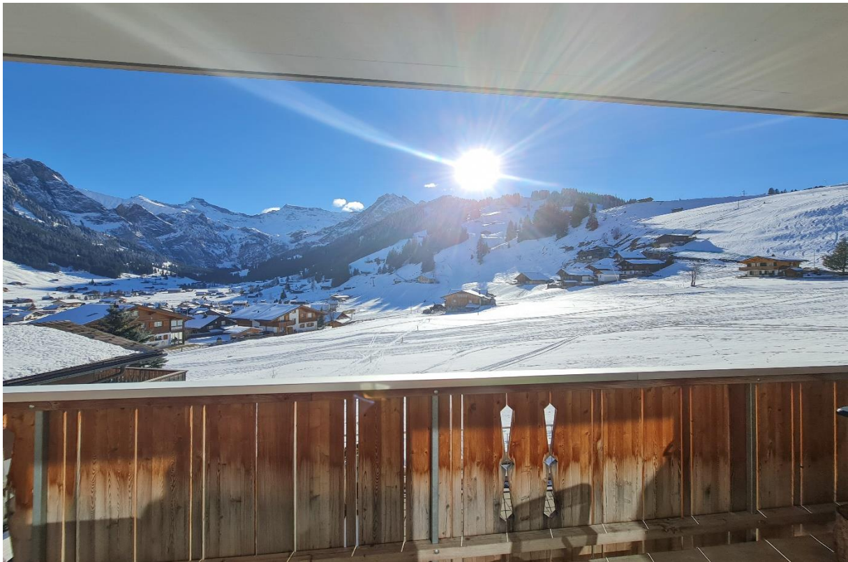
Der Sonnenbalkon mit freier und unverbaubarer Aussicht - Eckbalkon