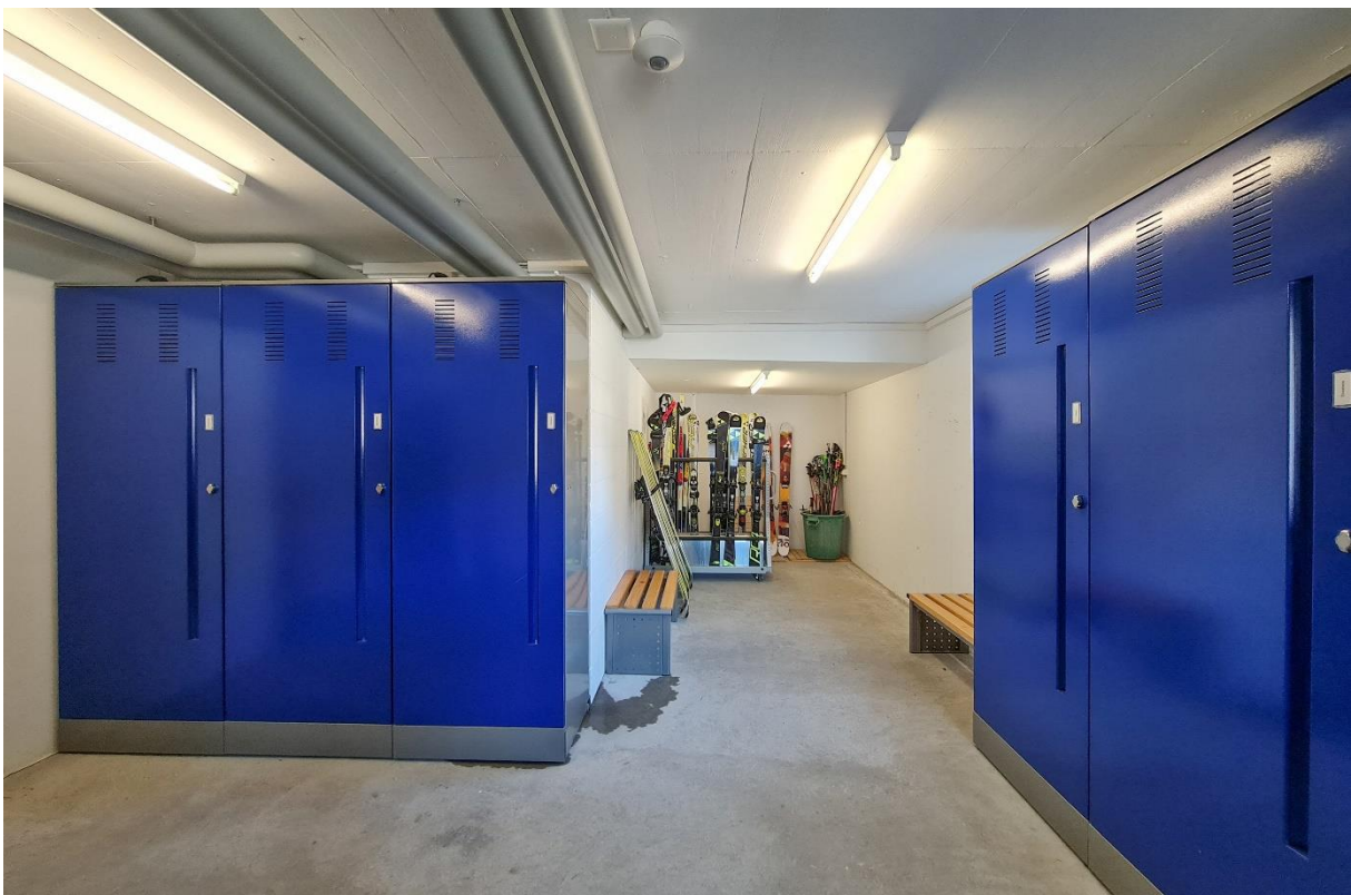
Der gemeinschaftliche Skiraum mit eigenem Schrank und eingebautem Skischuhrockner