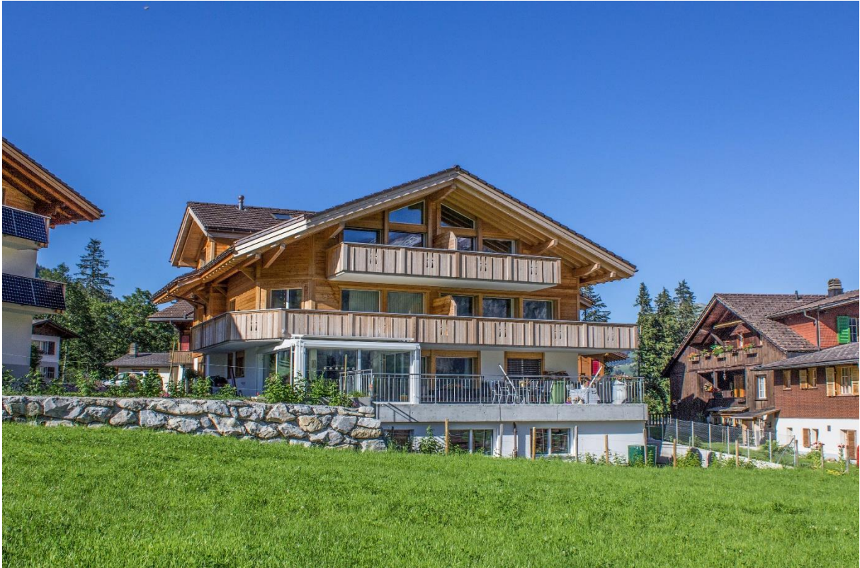
Die Aussenansichten vom Mehrfamilienhaus mit einem Spielplatz für Kinder im Sommer