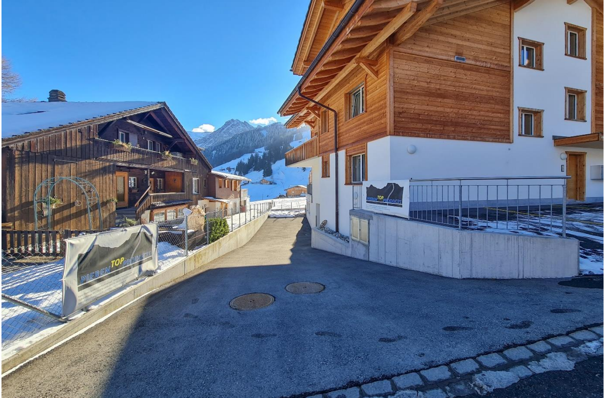
Die Zufahrt in die Einstellhalle mit den Autoabstellplätzen, Lift von der Einstellhalle in die Wohnung