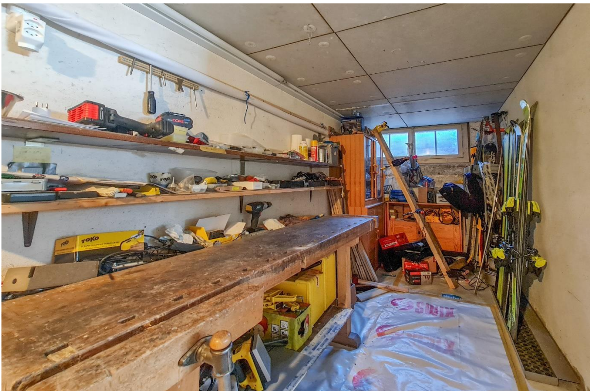
Der gemeinschaftliche Werk- und Bastelraum