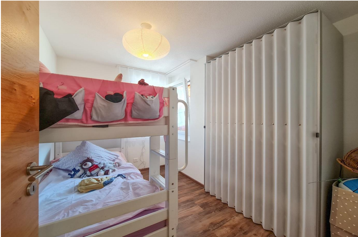
Das Schlafzimmer Nr. 2 – Kinderzimmer oder Büro