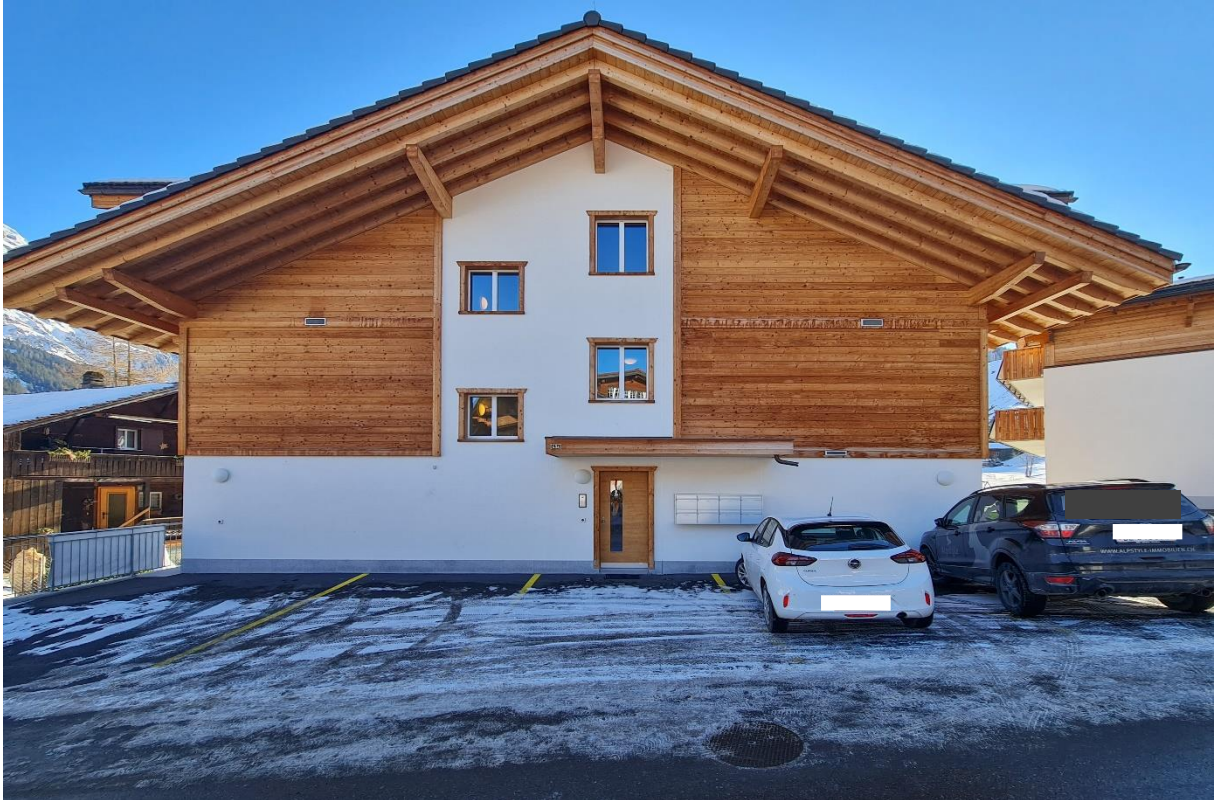
Die Besucherparkplätze mit dem Zugang zum Haus und Treppenaufgang sowie Lift