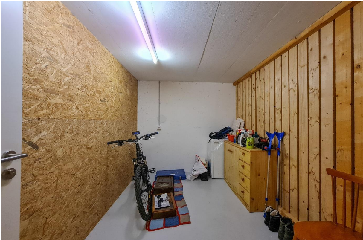
Der eigene Kellerraum mit Stromanschluss