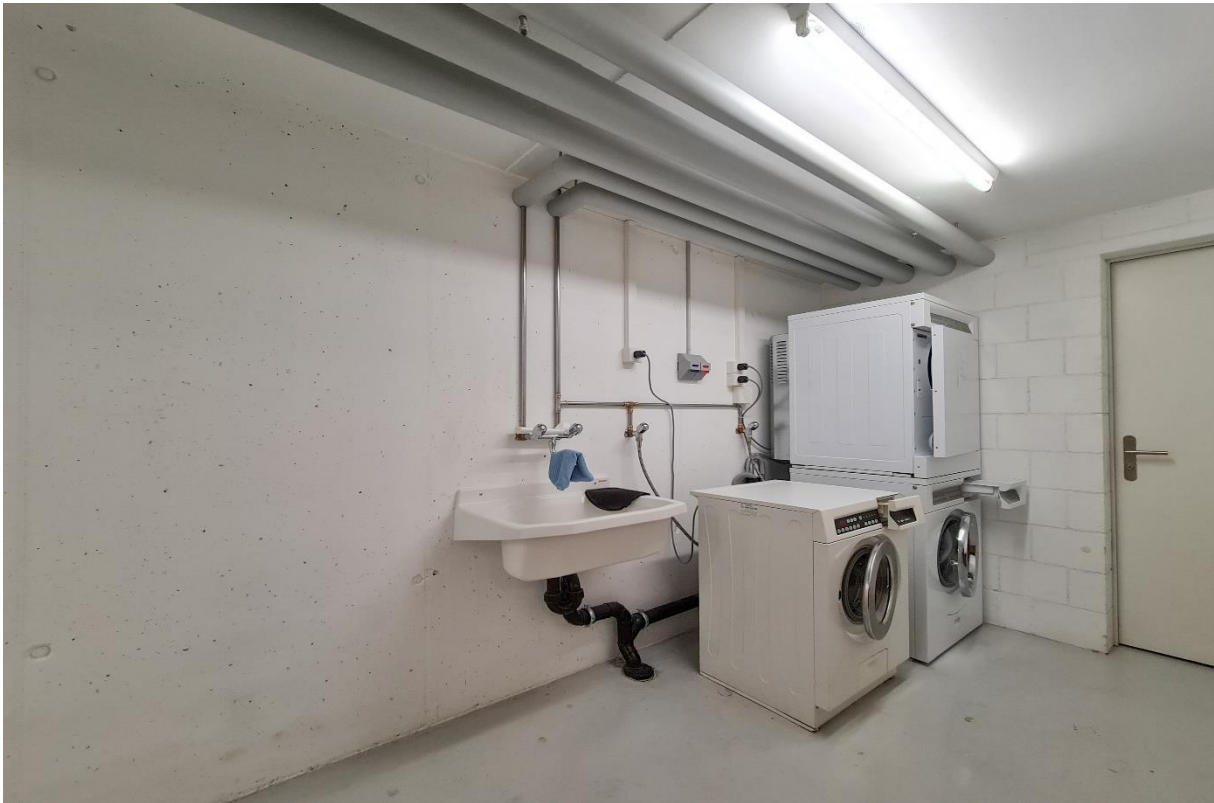
Die gemeinschaftliche Waschküche mit zwei Waschmaschinen und Tumbler