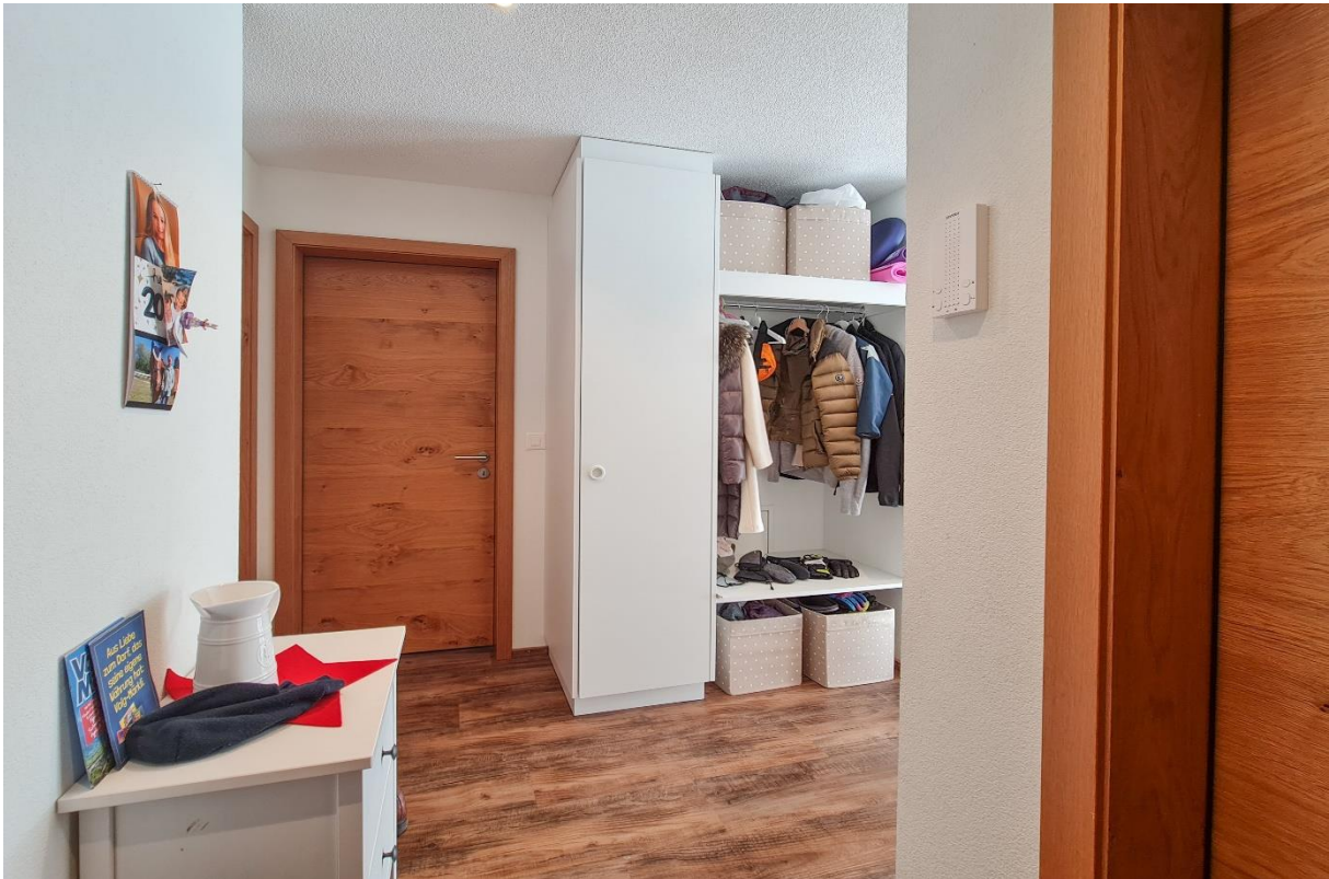
Der Eingangsbereich mit Garderobe und anschliessendem Wohnraum