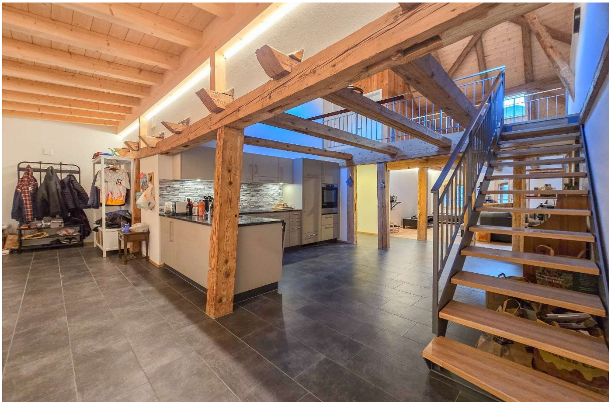
Die zentral positionierte Küche mit dem Treppenaufgang auf die Galerie