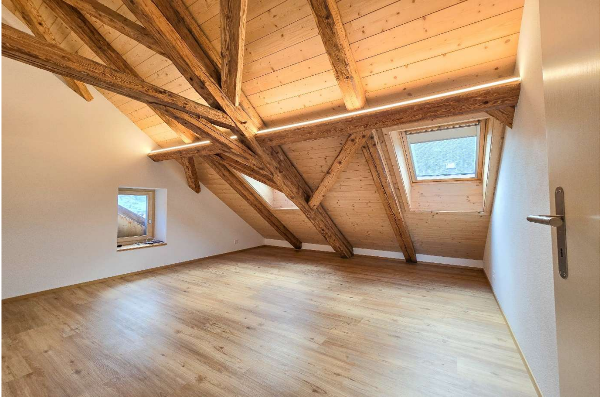
Zimmer Nr. 3