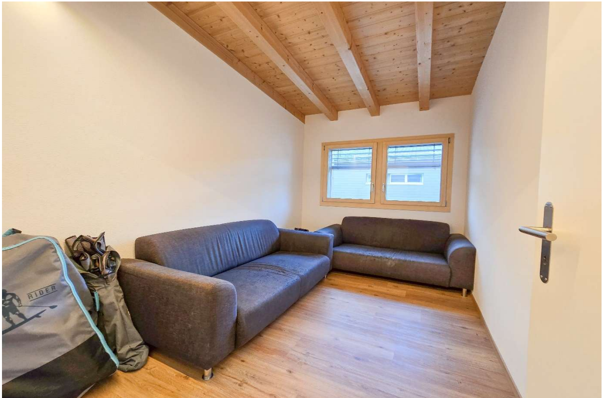
Zimmer Nr. 2

Das Badezimmer mit Eckbadewanne, walk in Dusche, Toilette, Handwaschbecken und Wäscheturm