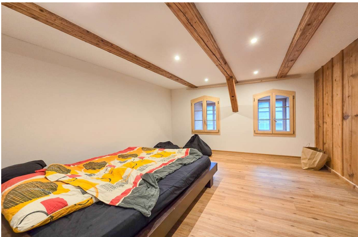
Zimmer Nr. 1