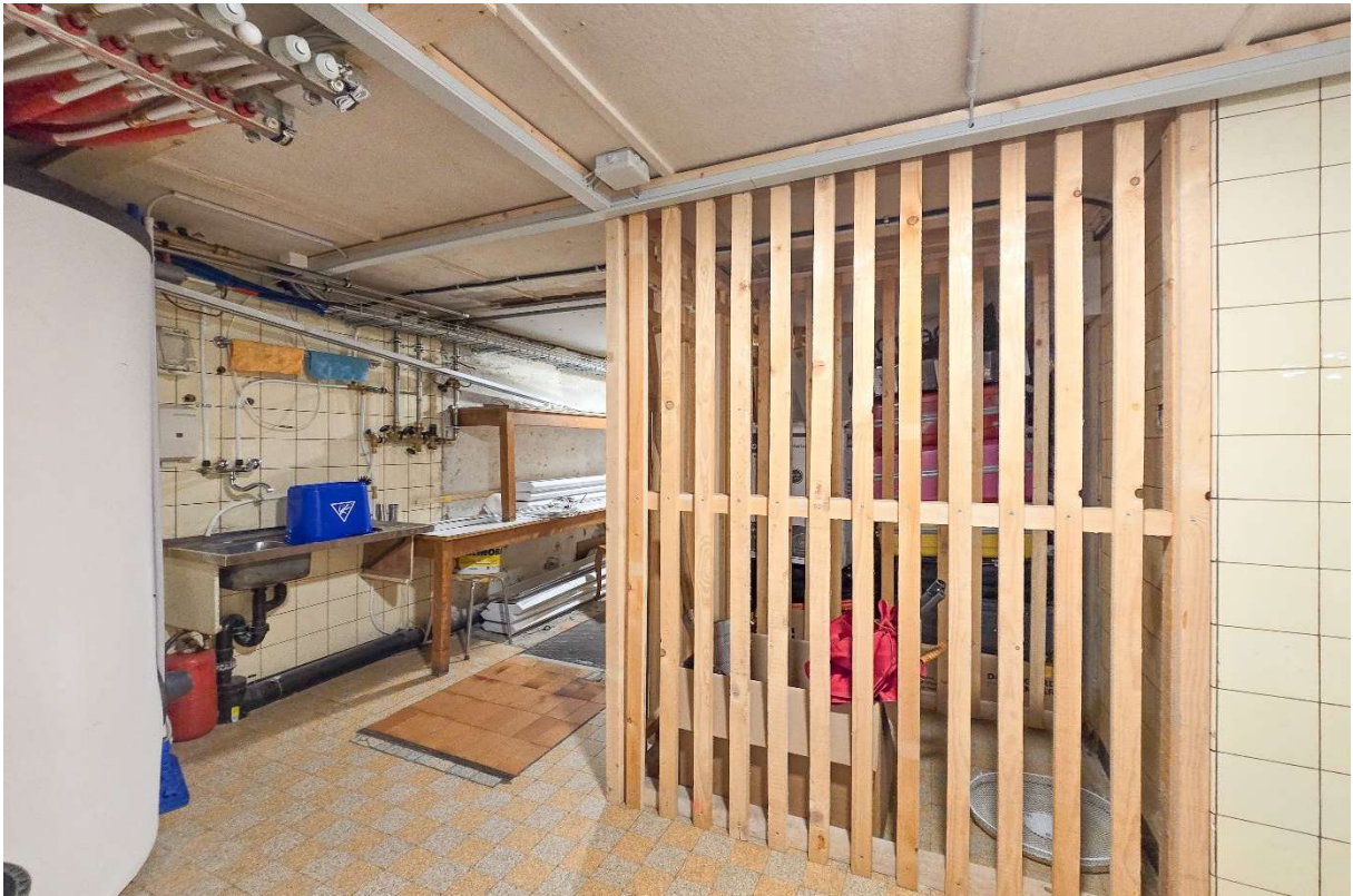
Das eigene Kellerabteil