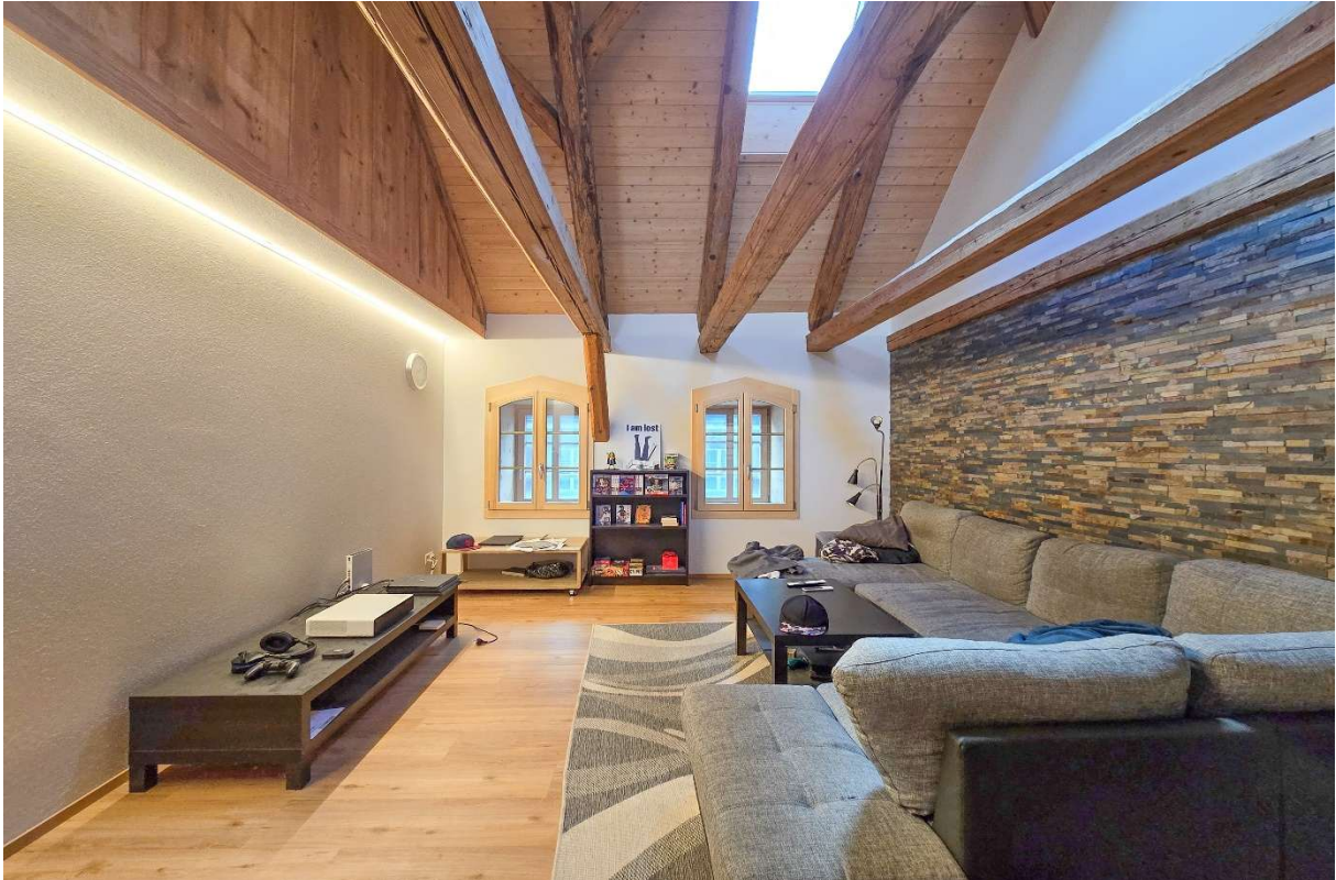
Das Wohnzimmer mit Holzbalken und Dachfenster