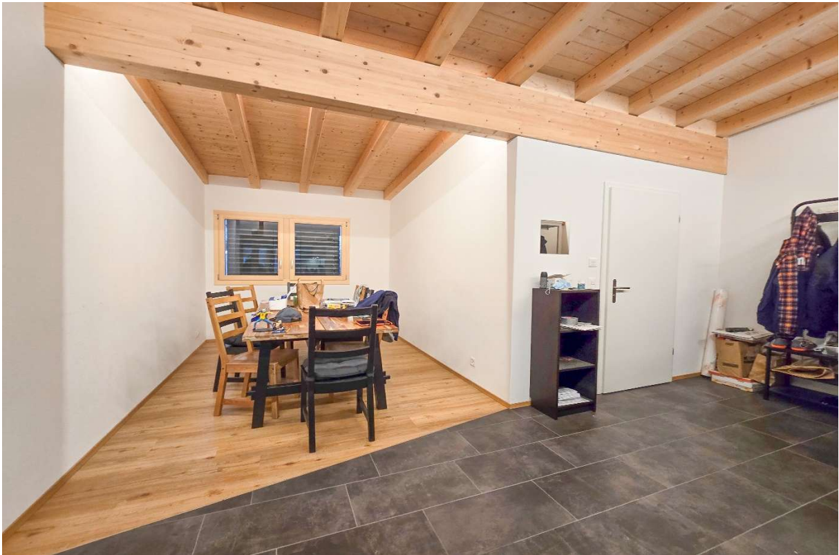
Der Eingangsbereich mit dem separaten Esszimmer