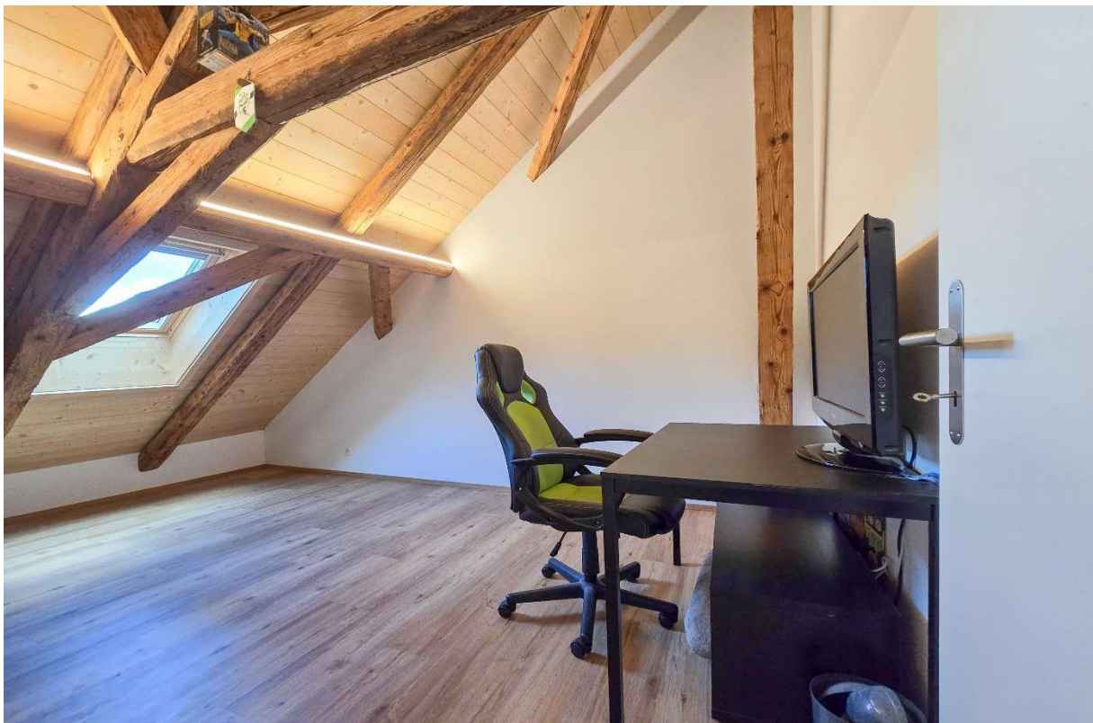
Zimmer Nr. 4