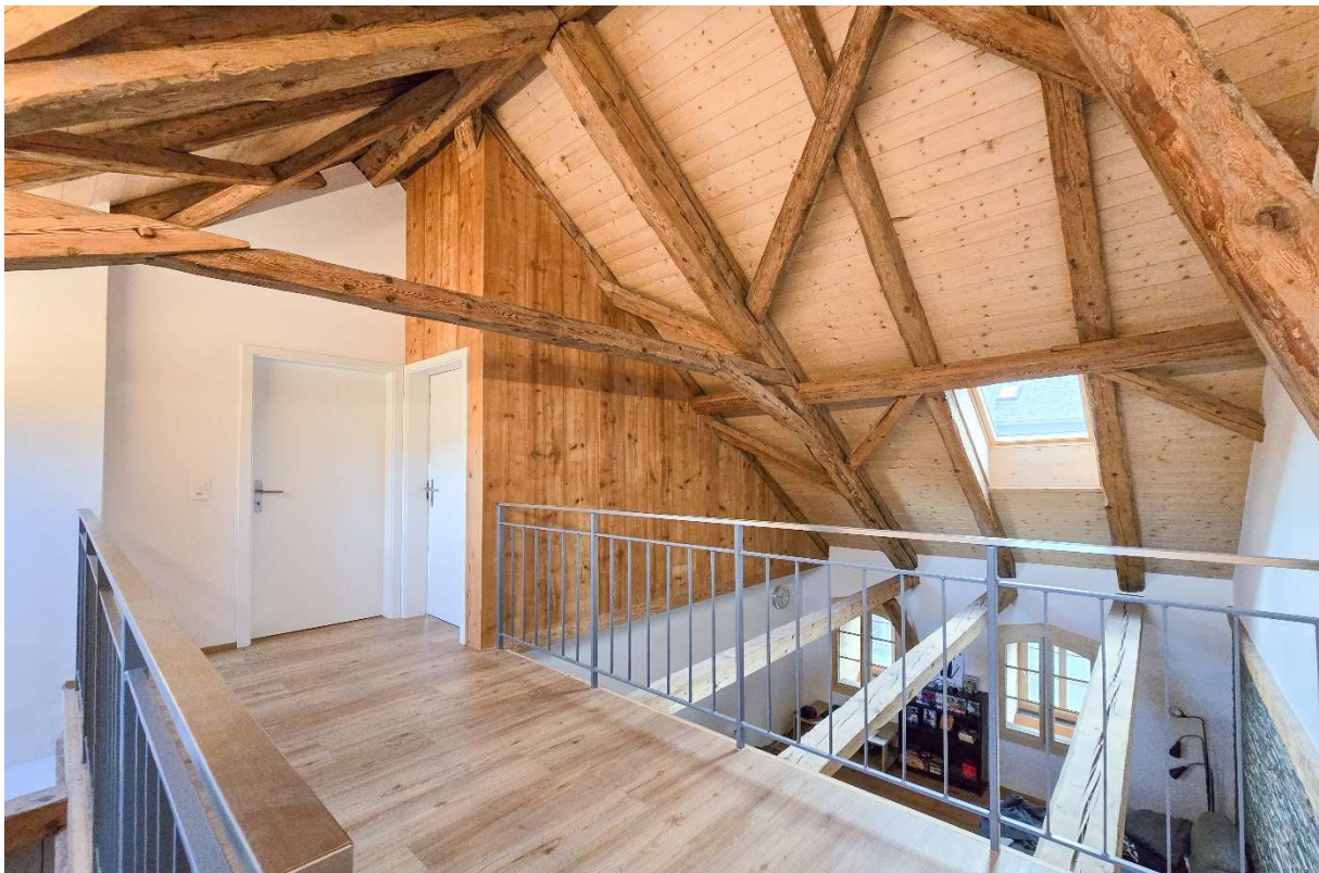
Die Galerie mit 2 Schlafzimmern