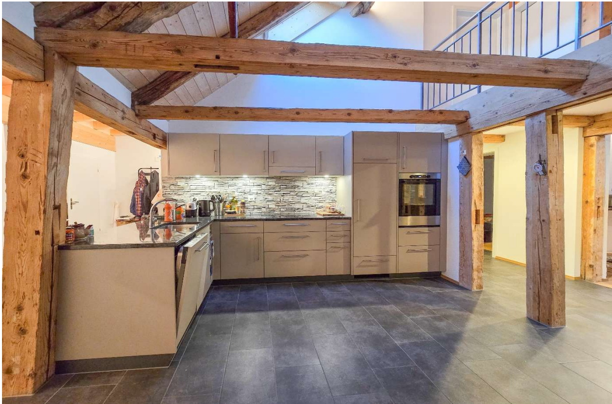
Die offene Küche mit Kühlschrank, Geschirrspüler, Backofen, Glaskeramikherd und Dunstabzug