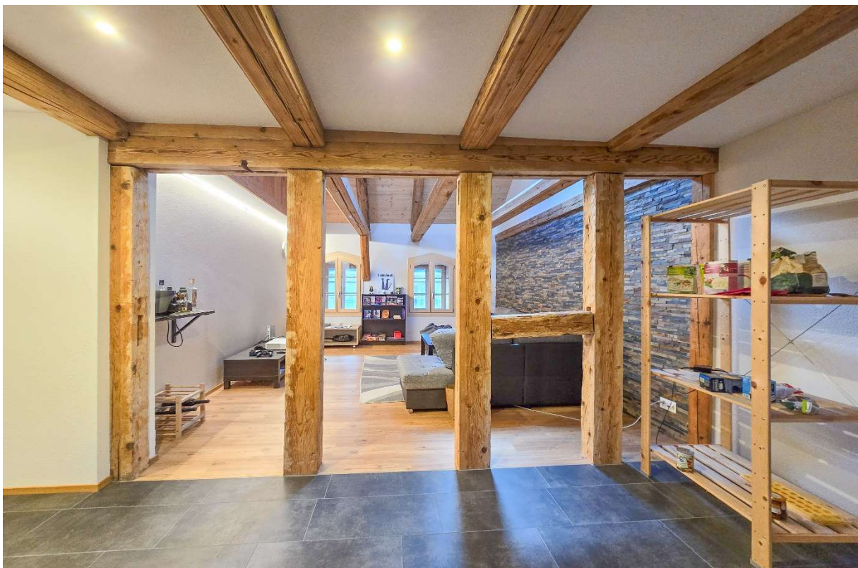
Blick zum Wohnzimmer