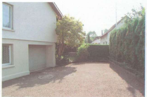
Garagenzufahrt mit Kehrplatz