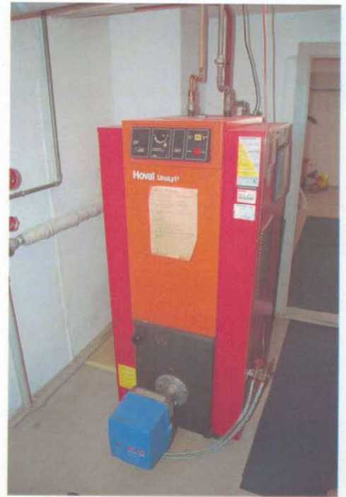
Ölheizung ca. Jg. 86 mit Kombiboiler