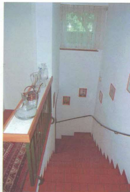
Verbindungsstreppe zum UG