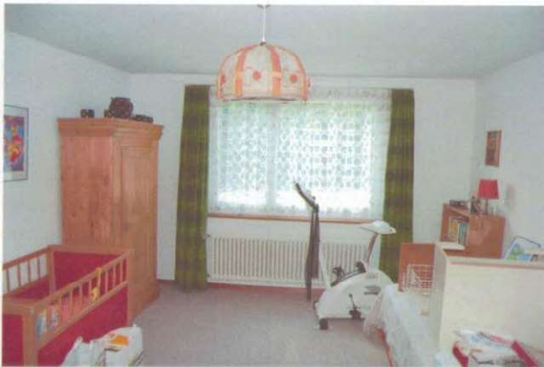
Gästezimmer im UG