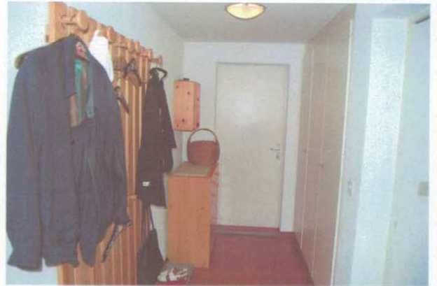
Fortsetzung Korridor mit Garderobe