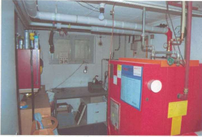
Heizungsraum mit Werkstatt