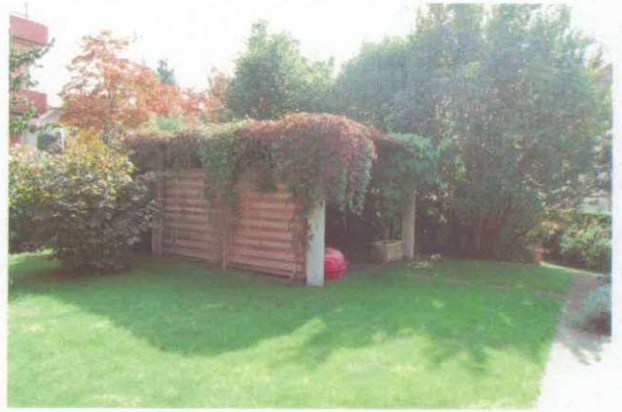
Garten mit Pergola