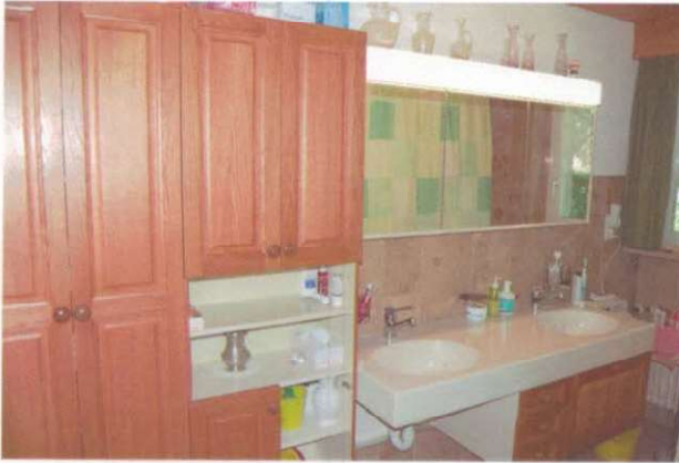
Bad mit Einbauschränk