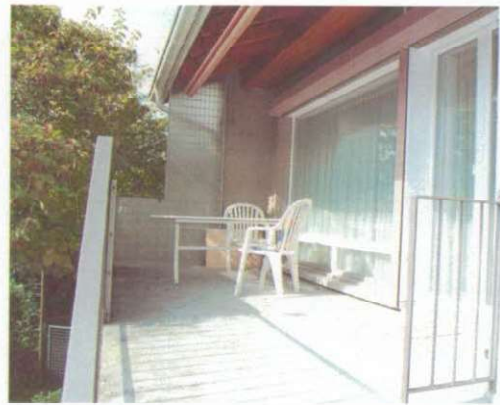
Terrasse mit Aussentreppe