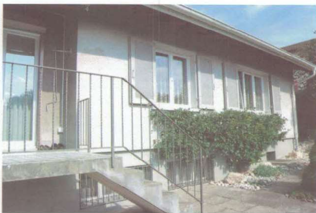
Blick aus der Gegenrichtung