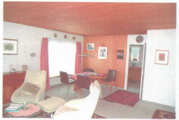
Fortsetzung Wohn-/ Esszimmer