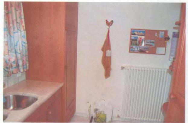
Blick aus der Gegenrichtung