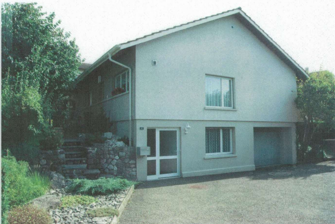
Nordwest-Ansicht mit Vorplatz, Hauszugang und Garage