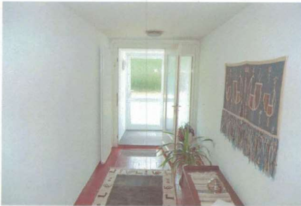
Hauzugang mit Korridor und Garderobe im UG