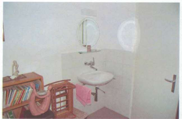
Fortsetzung Gästezimmer mit Waschtisch