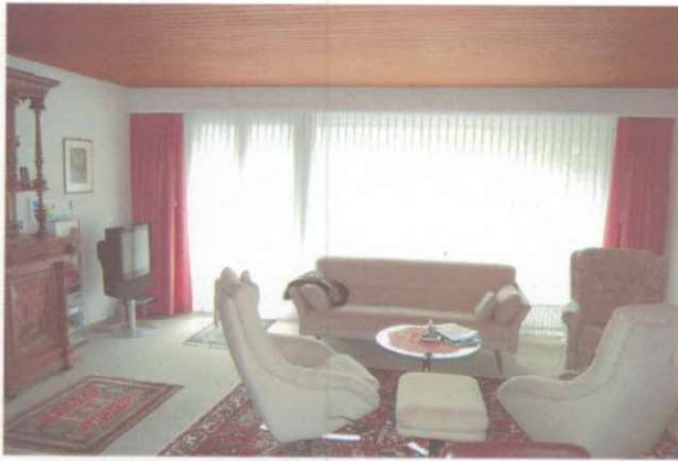
Wohn-/ Esszimmer im EG