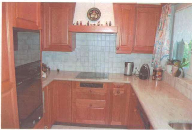
Die Küche wurde ca. 1990 ersetzt