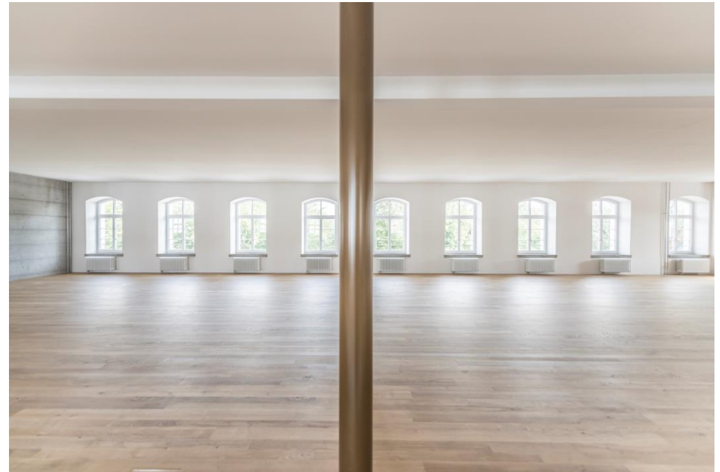
Mietfläche 1. OG