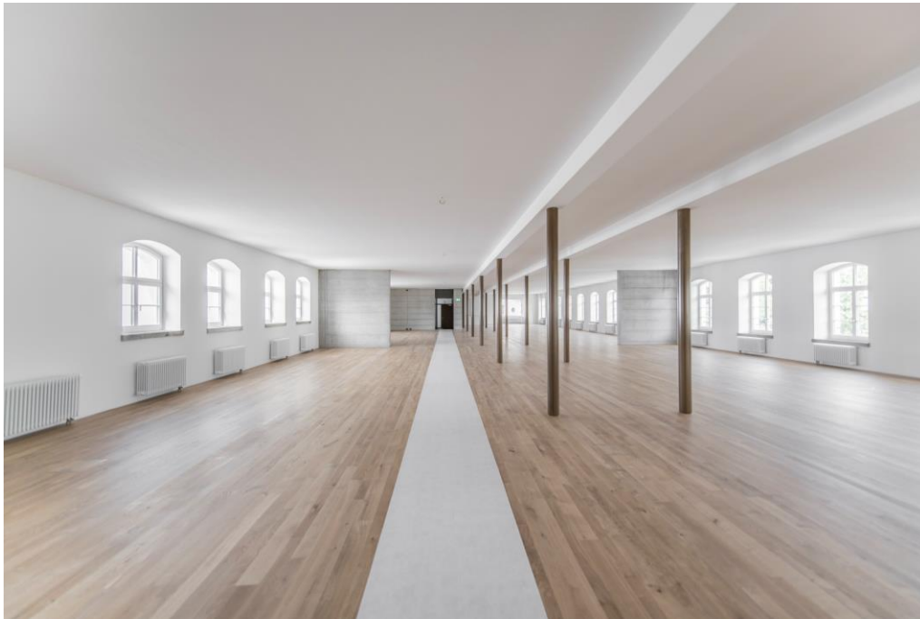
Mietfläche 1. OG