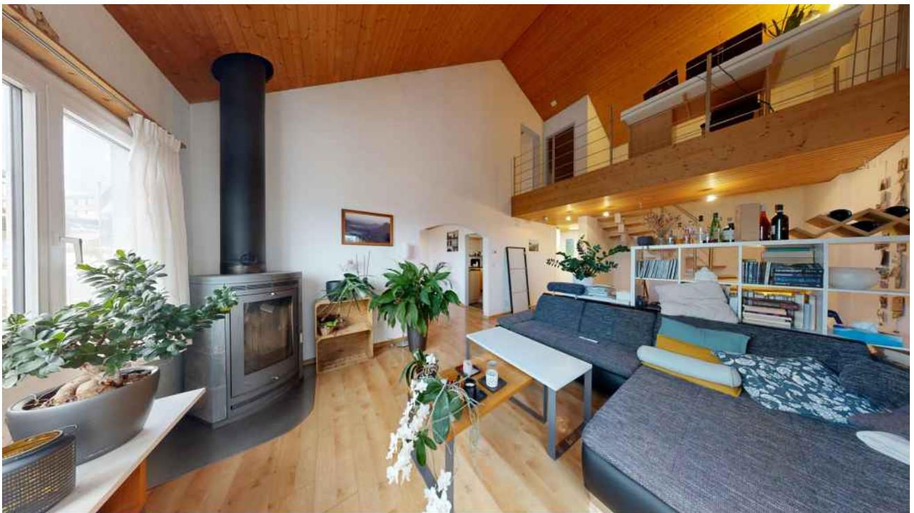
Hell, offen und sehr heimelig