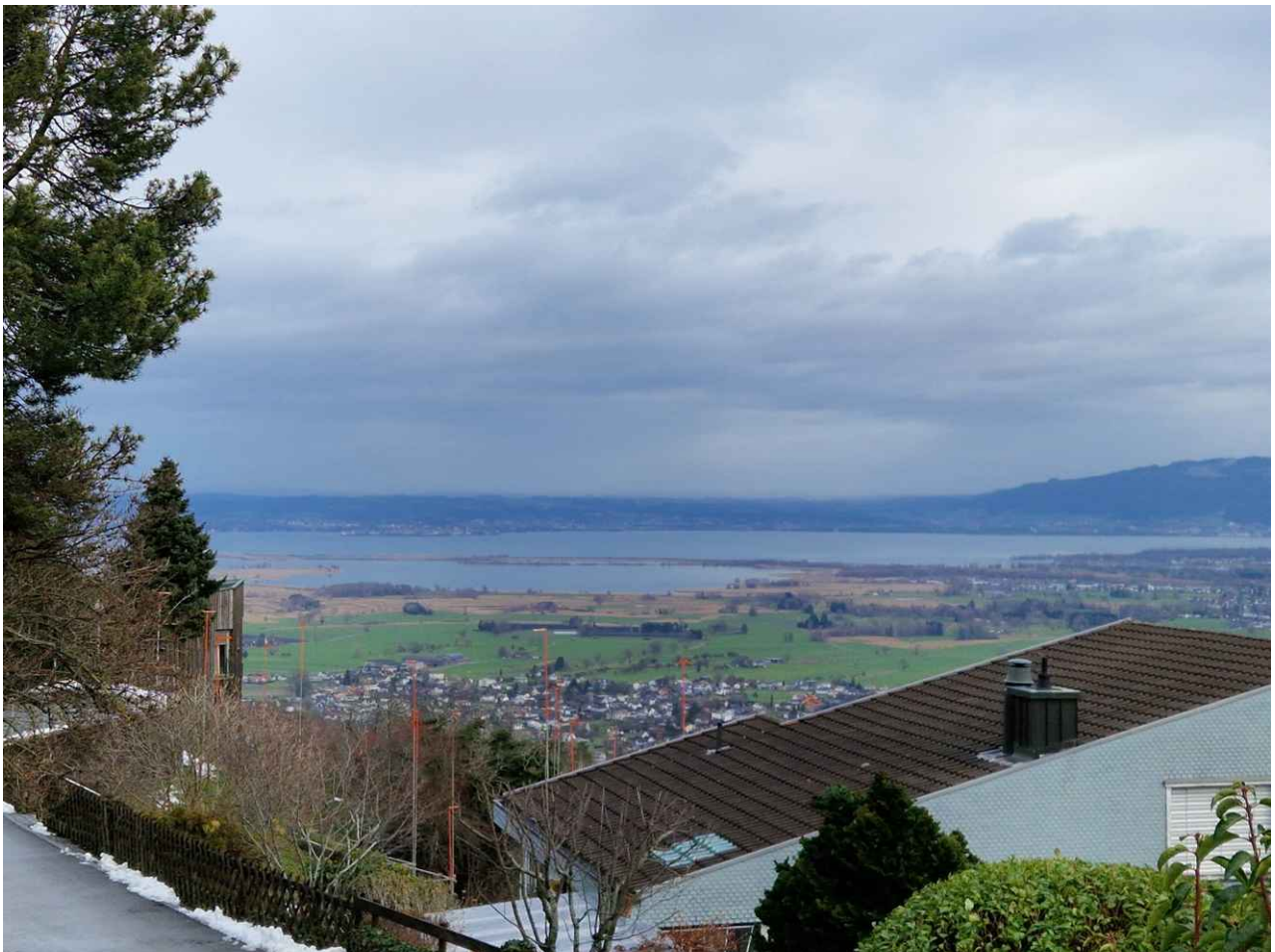
Wunderbare Aussicht auf den Bodensee