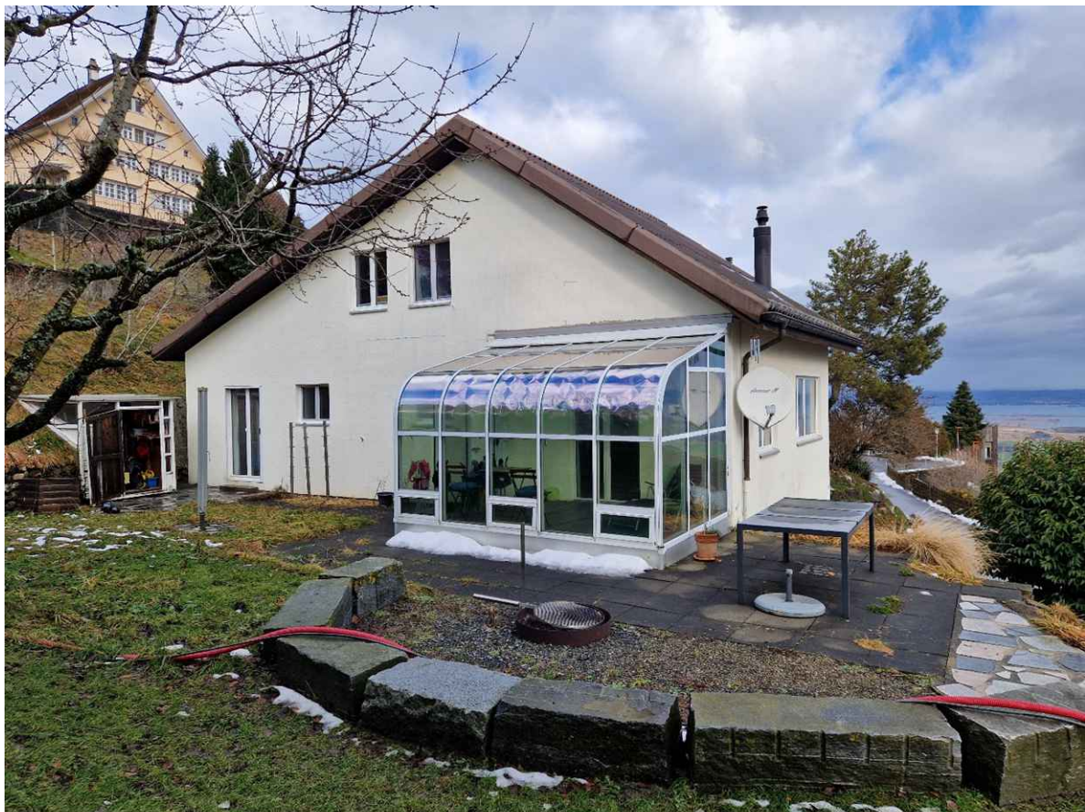
Ihr neues Zuhause erwarte Sie?