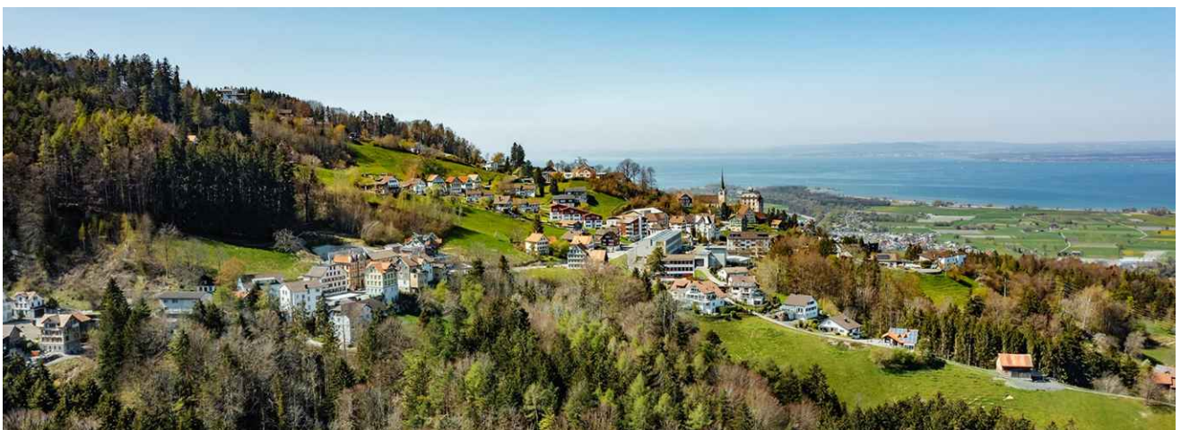
Luftaufnahme Gemeinde Au

Freizeit im Dorf! Die Vereine und Organisationen leisten durch ihre kulturellen, sportlichen und gesellschaftlichen Angebote einen wertvollen Beitrag zur Steigerung der Vielfältigkeit des Dorflebens. Die bunten Aktivitäten kommen praktisch jedem Freizeitbedürfnis entgegen. Grossanlässe wie die Viehschau, der Jahrmarkt, die Gewerbeausstellung, der Weihnachtsmarkt und der Historische Bergsprint bereichern als Höhepunkte das Dorfleben weiter. Auch das Schwimmbad Ledi, verschiedene Themen- und Wanderwege sind feste Bestandteile des Naherholungsangebotes.