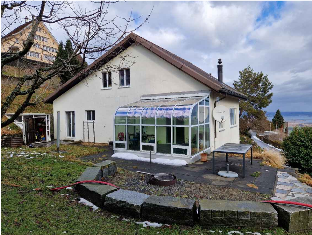
Attraktives Haus mit Wintergarten, Feuerstelle und Sicht auf den Bodensee