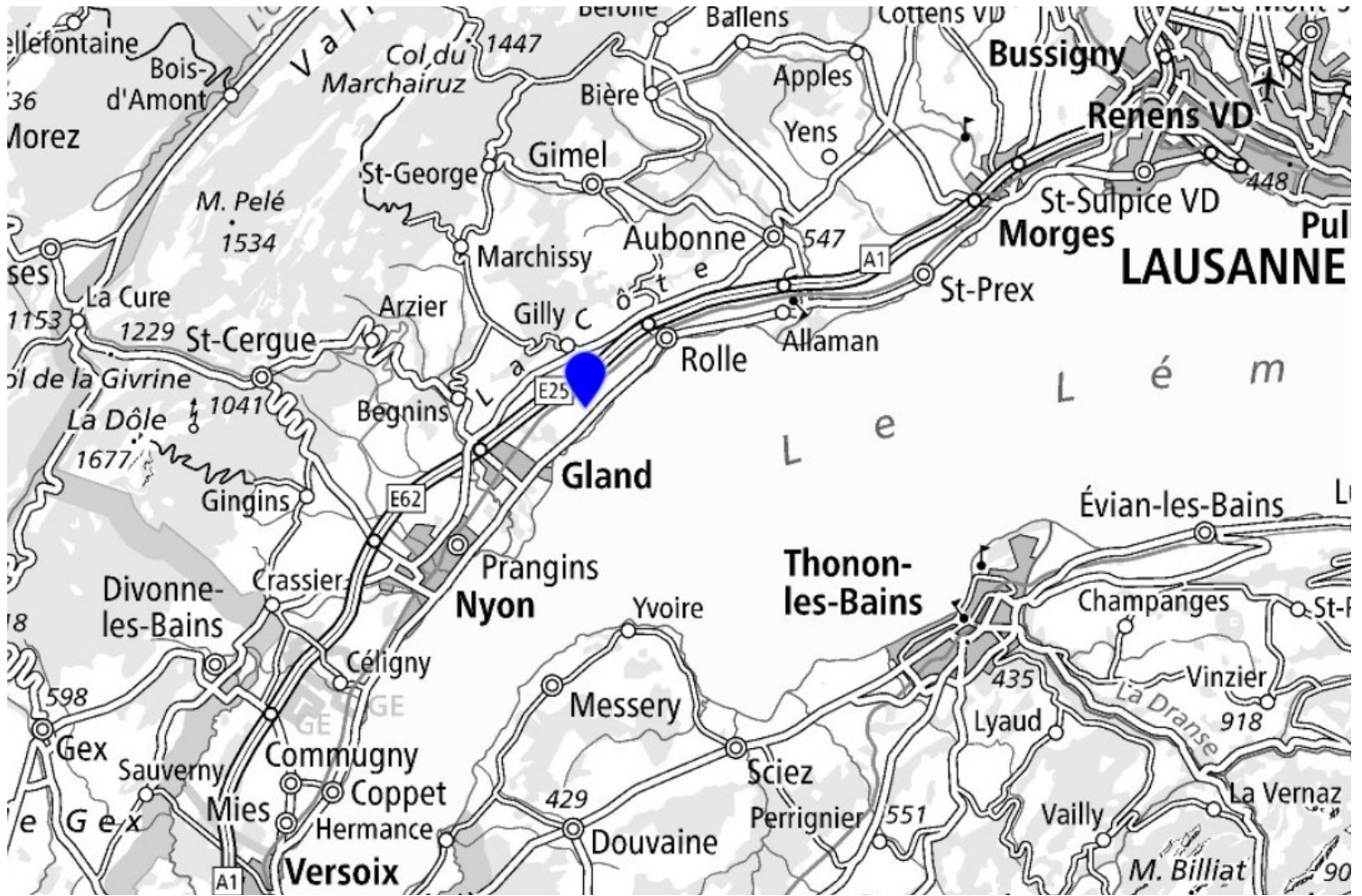
Bursinel - route du Village 24