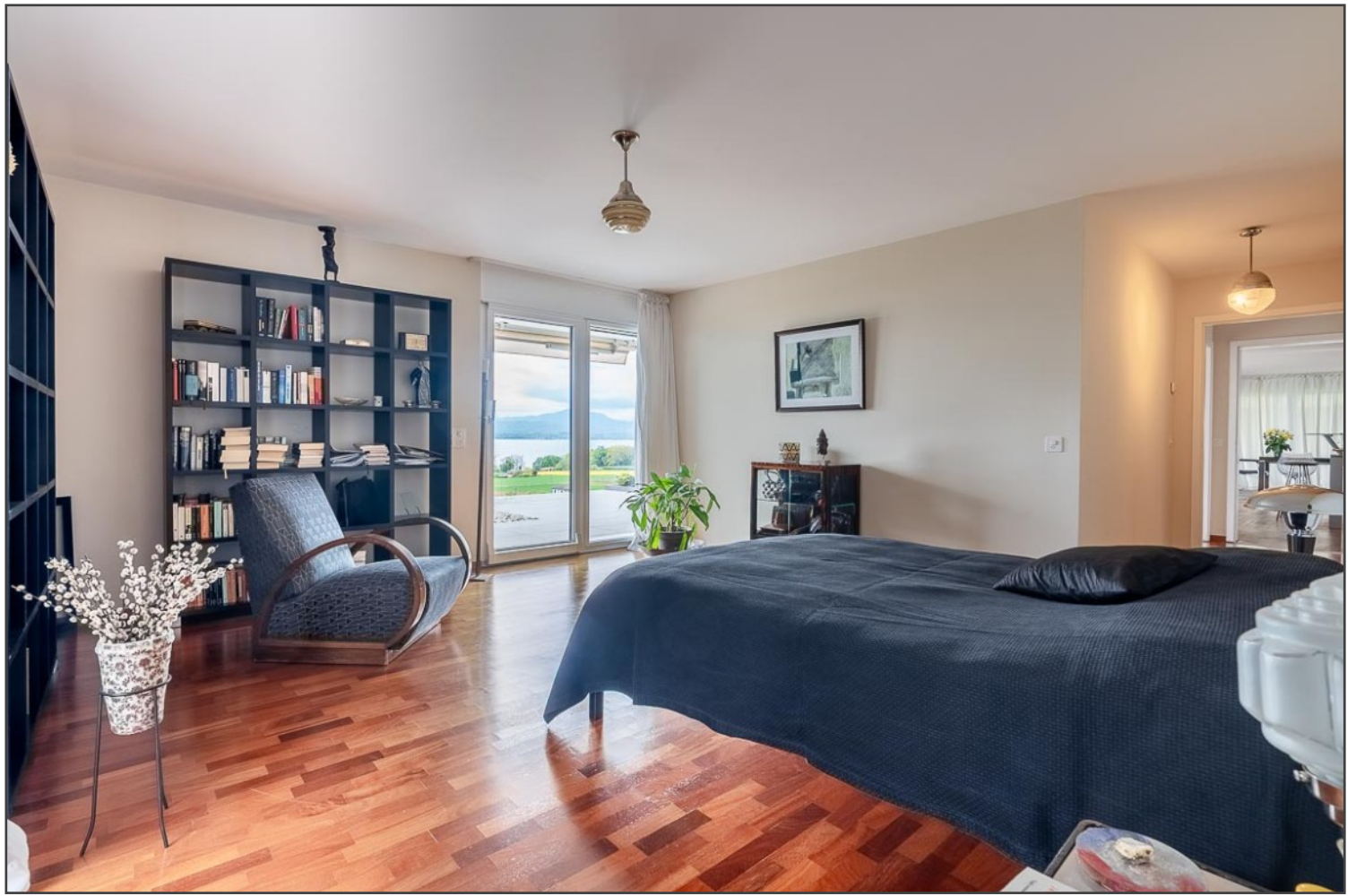
« chambre à coucher en suite avec dressing et salle de bain »