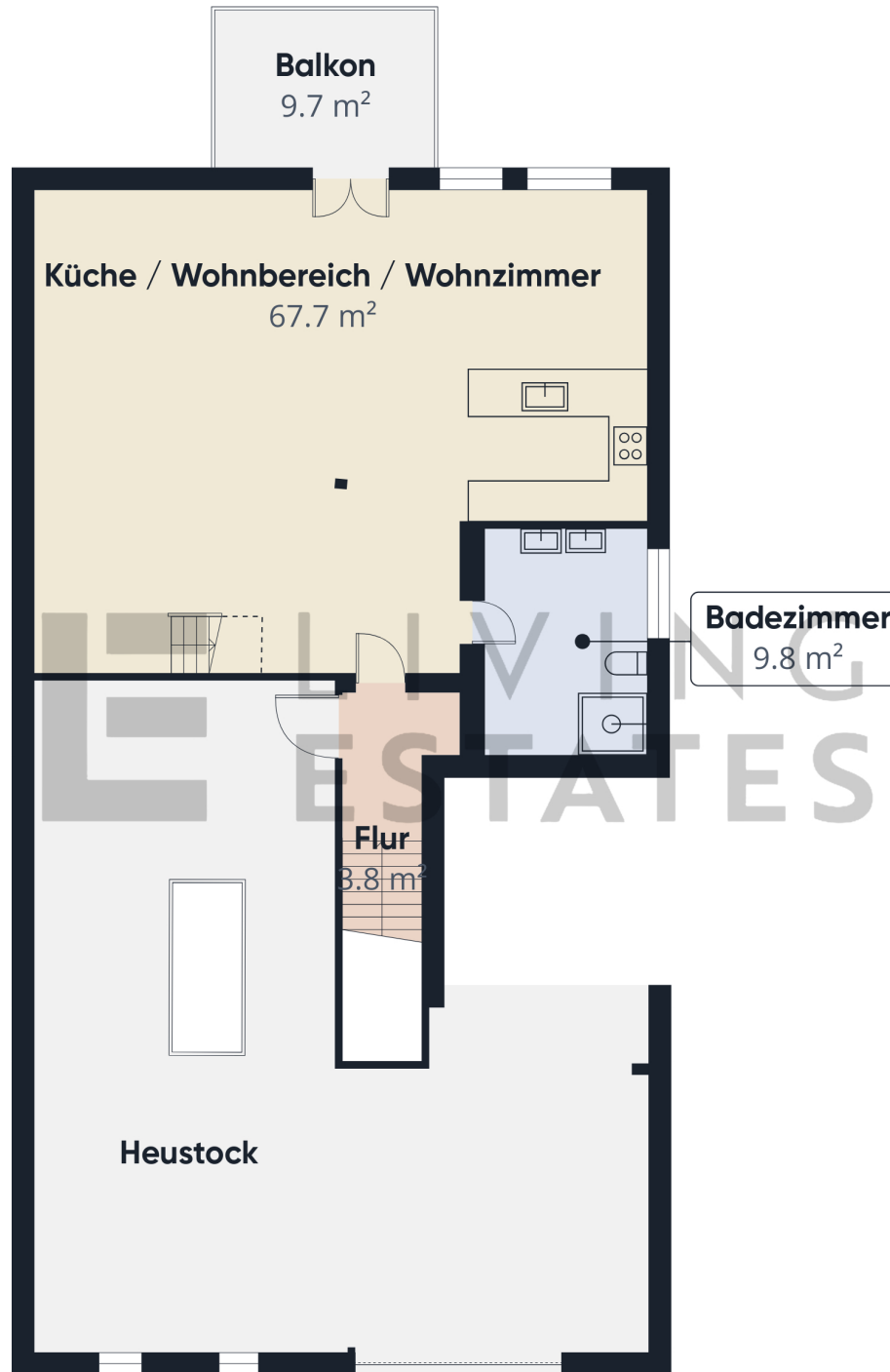
Etage 1 Gebäude 3