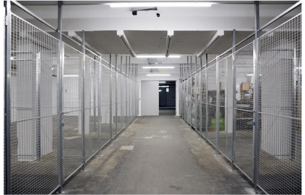
Lagerflächen 1. UG